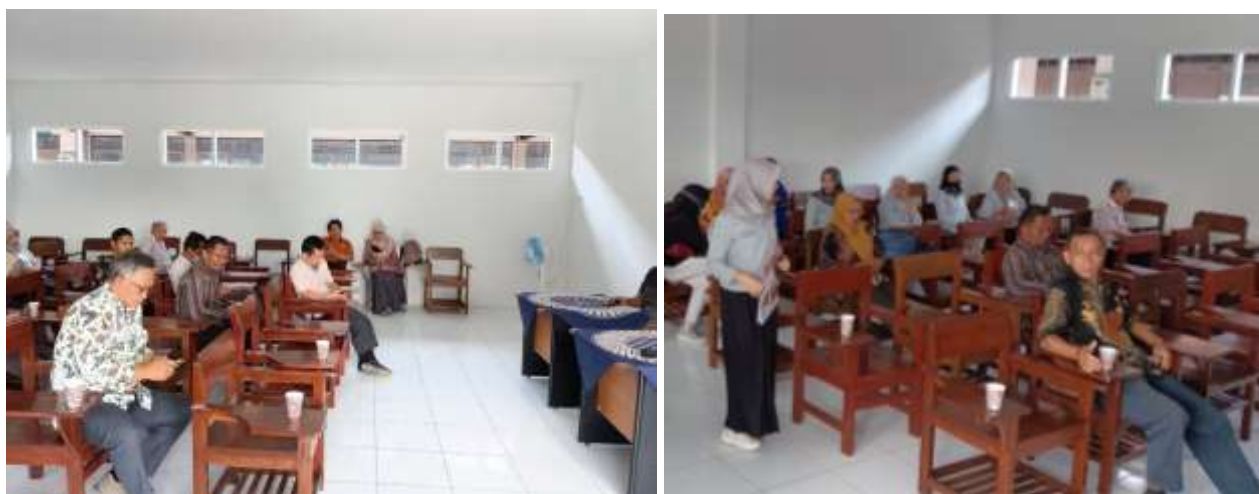
Rapat Penyusunan VMTS