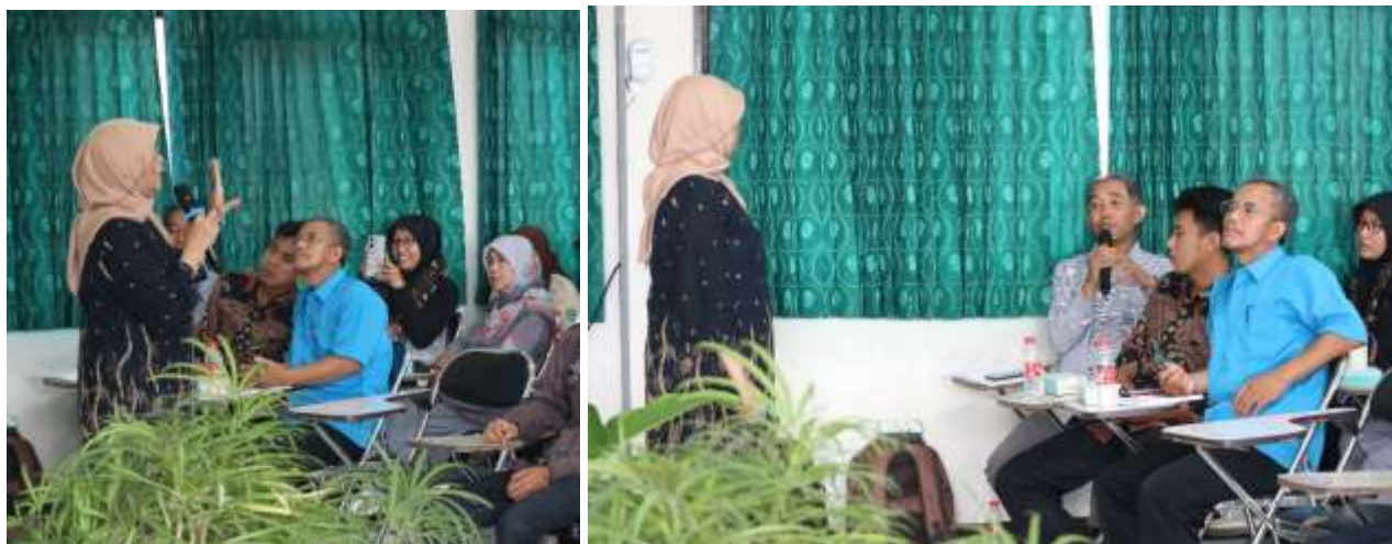
Workshop Penyusunan VMTS STT Wiworotomo